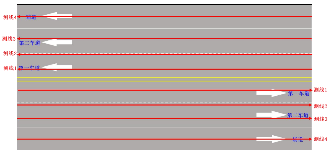
图 6-3 道路上方雷达探测布线图