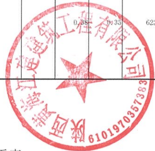
分部分项工程量清单综合单价分析表