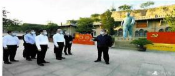
习近平在陕西榆林考察调研