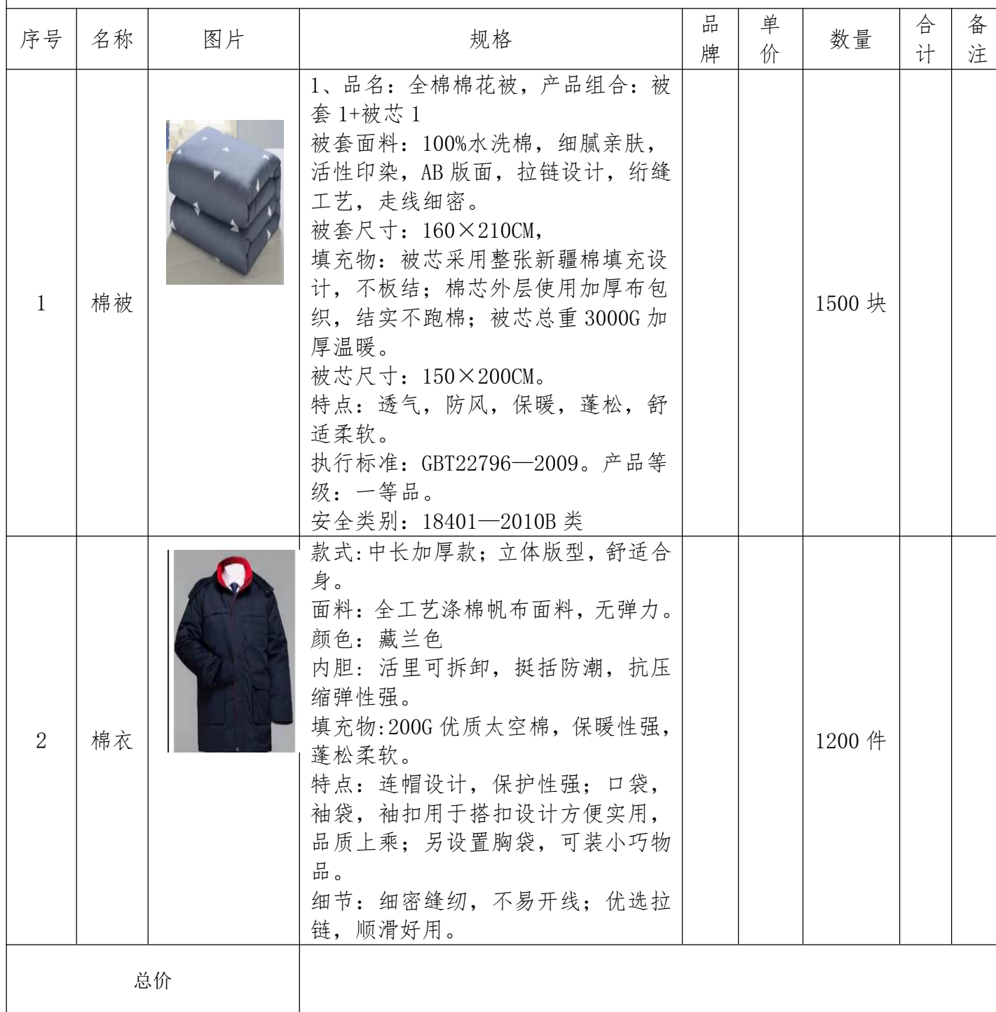
佳县应急管理局 2022 年应急物资采购预算清单