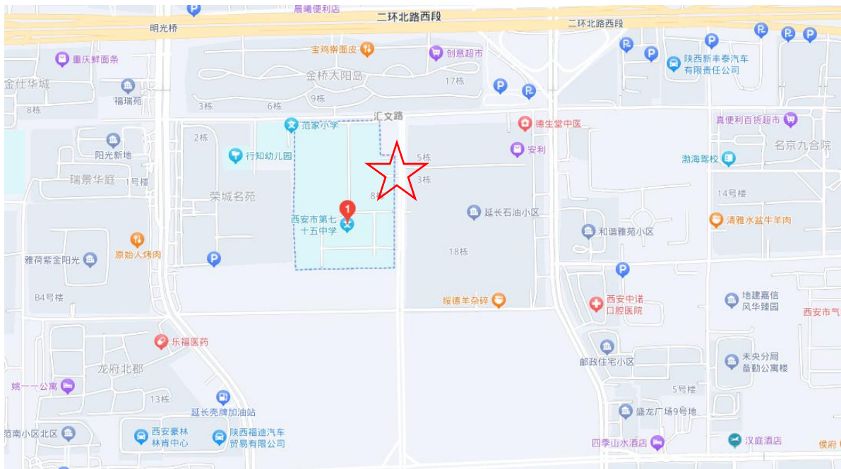
图 1-1 项目区位示意图

西安市第七十五中学位于西安市未央区汇文路以南，玄武西路以北，汇文南路以西。符合《陕西省城乡规划管理技术规定》等相关城市建设规定（详见图 1-1）