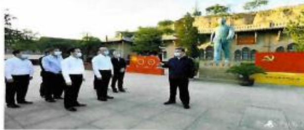
习近平在陕西榆林考察调研