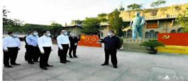
习近平在陕西榆林考察调研