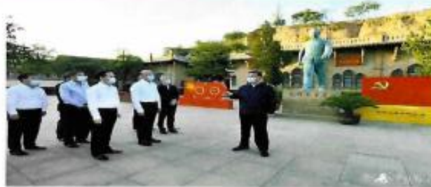
习近平在陕西榆林考察调研