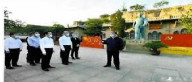
习近平在陕西榆林考察调研