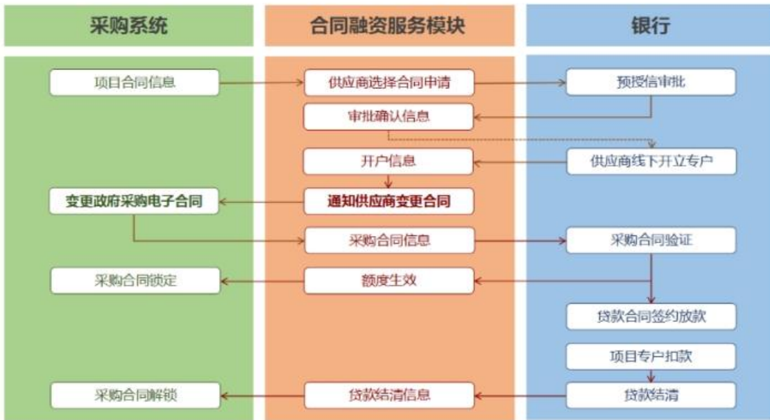
已签订采购合同申请流程