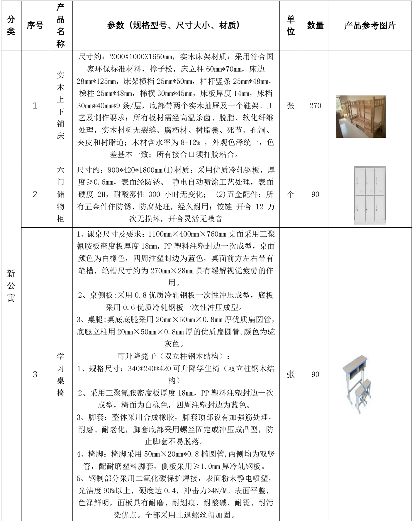
新建公寓及餐厅设施设备采购清单