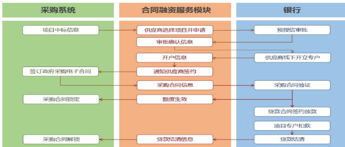
未签订采购合同申请流程