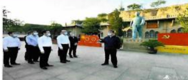
习近平在陕西榆林考察调研