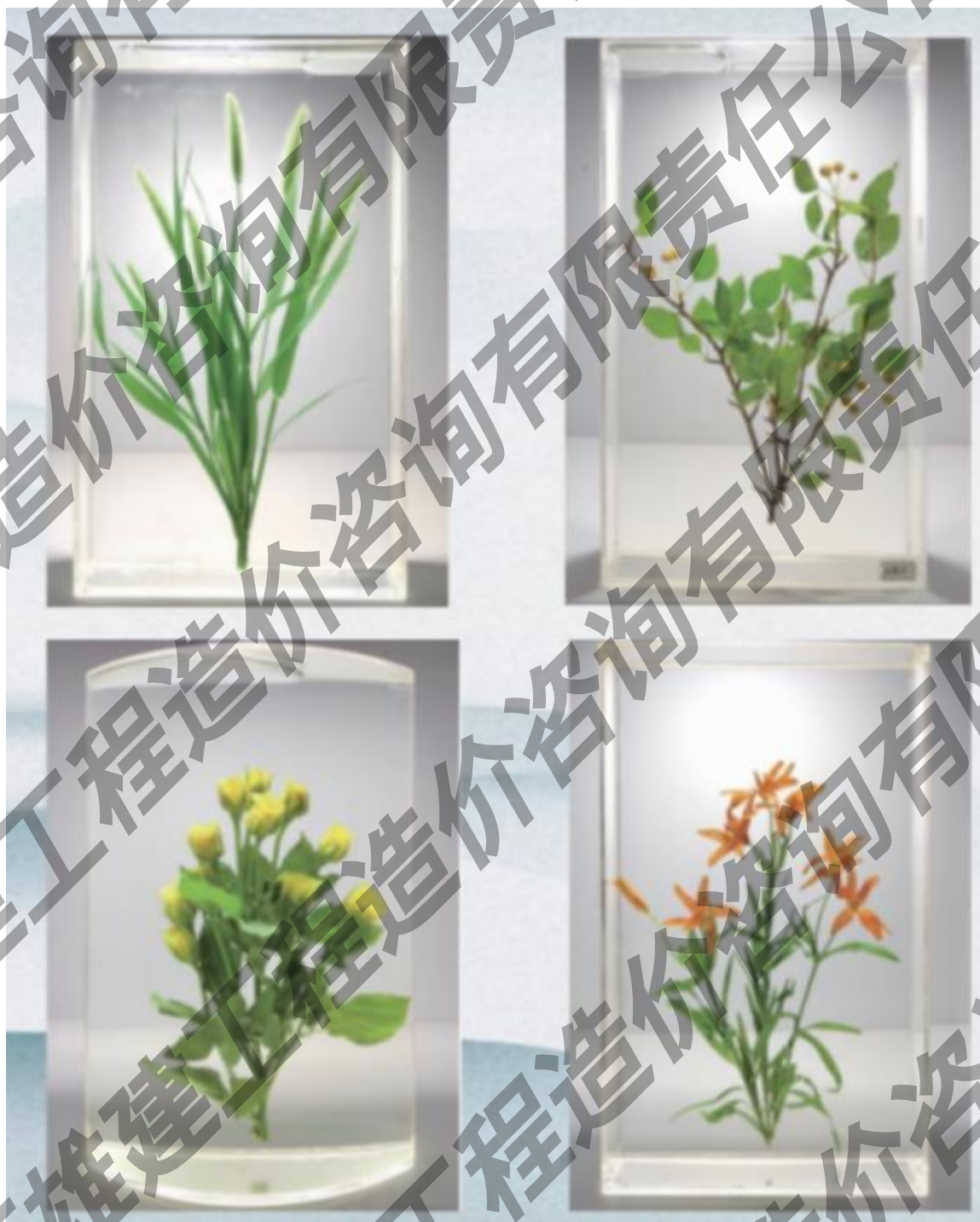
植物保色保鲜浸制标本