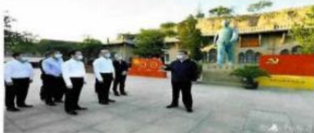
习近平在陕西榆林考察调研