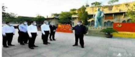
习近平在陕西榆林考察调研