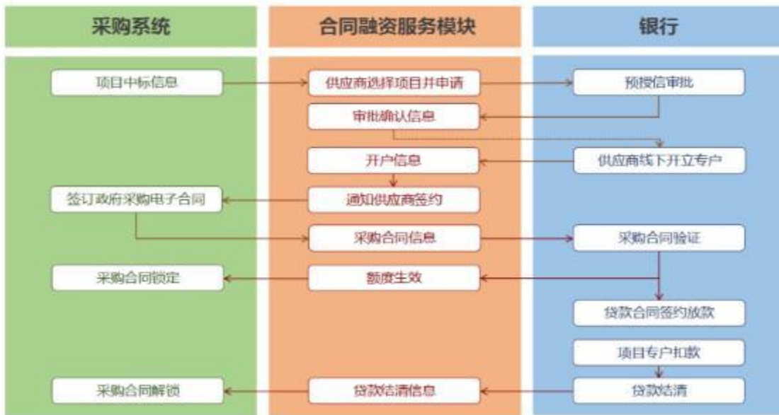
未签订采购合同申请流程