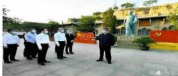
习近平在陕西榆林考察调研