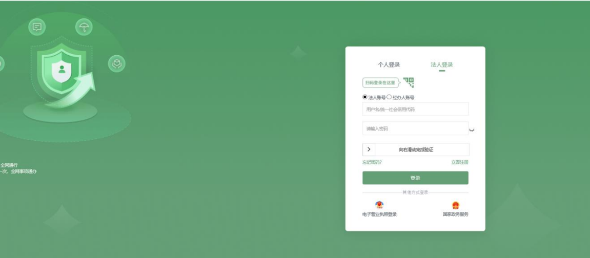
陕西省统一身份认证系统