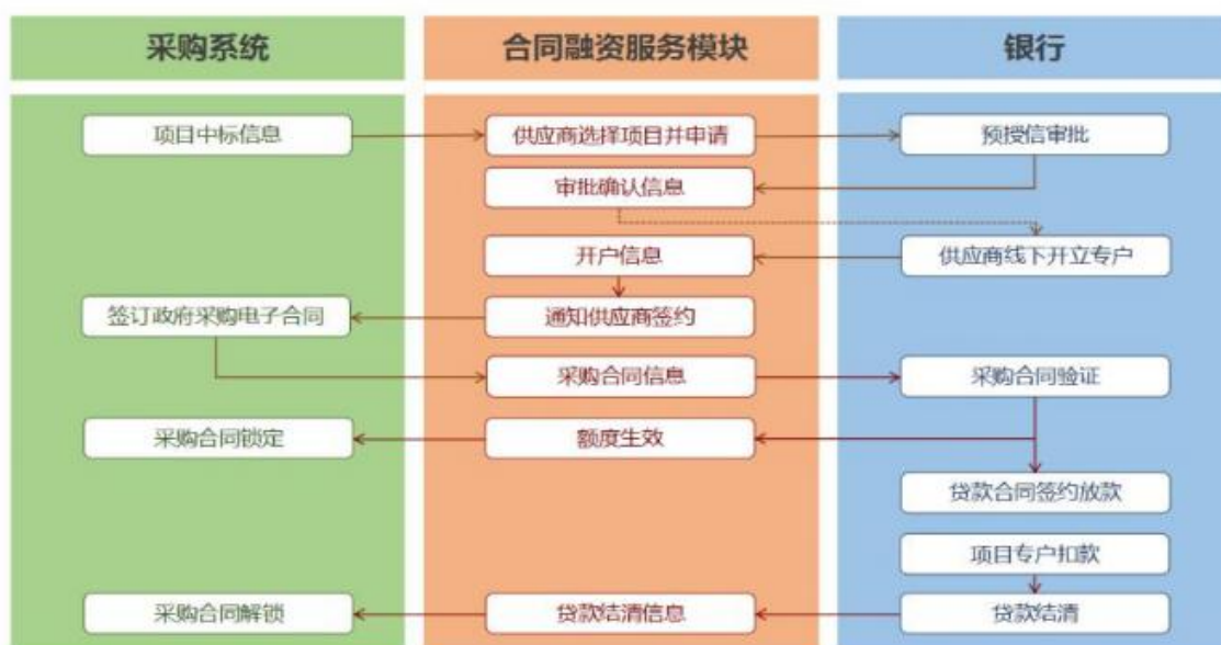
未签订采购合同申请流程