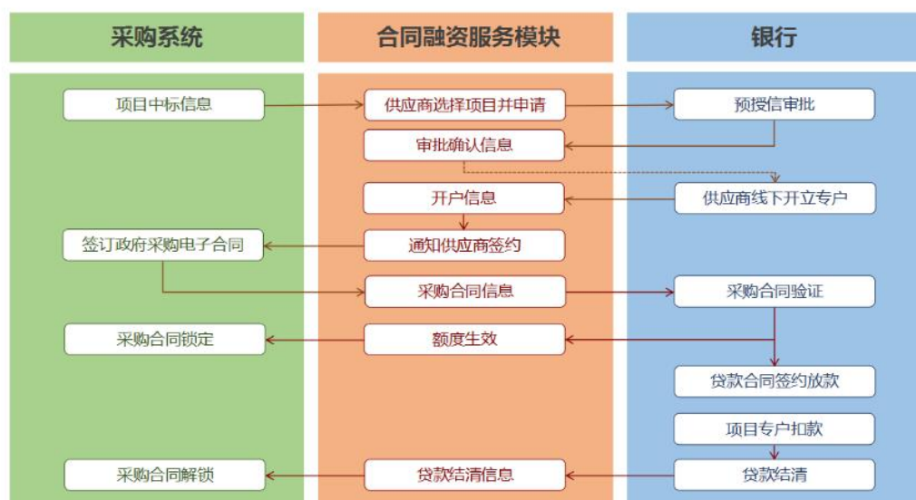
未签订采购合同申请流程