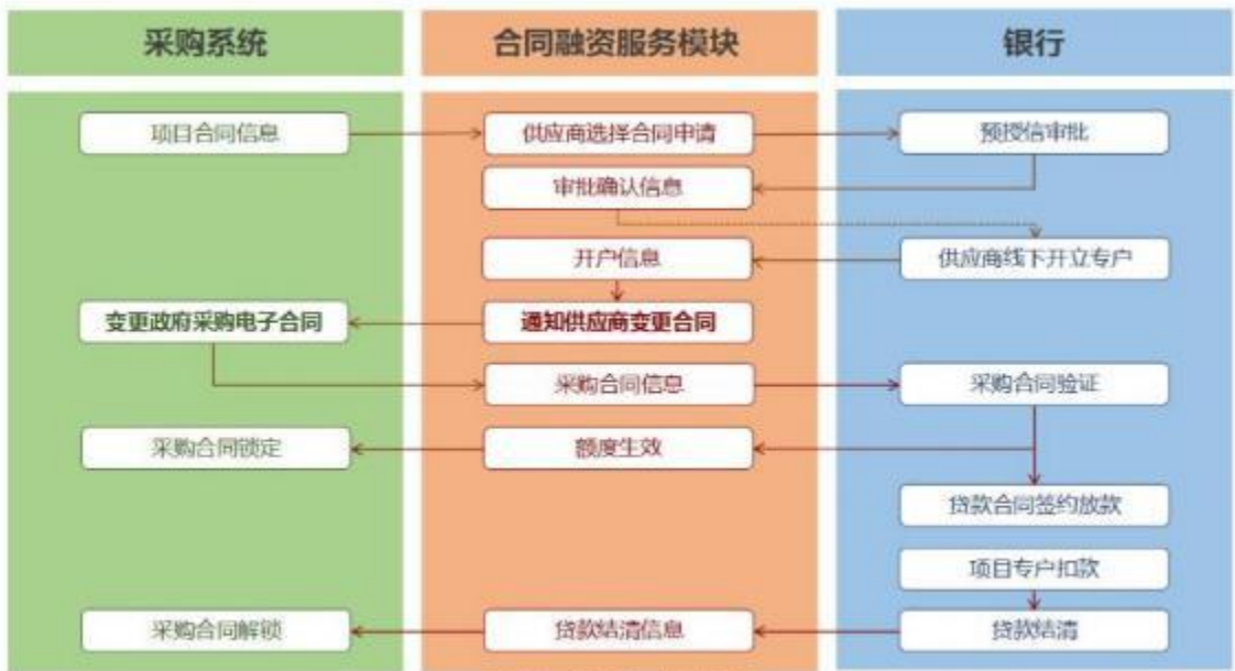
已签订采购合同申请流程