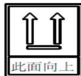
图 2 码垛标志

17. 标志：在棉帐篷的篷顶两侧印制蓝色底色+白色字体标志，标识高度比例为 0.8，字体黑体，100 加粗；永久性标签上标明“救灾专用”字迹应清晰、整洁。提供加盖公章的照片或设计图。