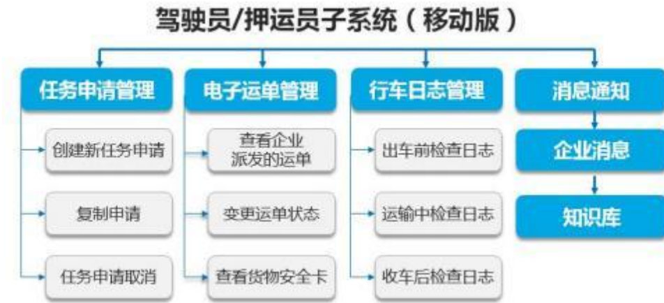
图 3 驾押人员子系统功能架构

主要面向驾驶员，实现驾驶员随车任务申请、电子运单管理、行车日志管理，消息通知等功能。系统基于安卓智能手机架构，运行于驾驶员配置的专用设备或者手机上。系统主要功能框架如下图所示：