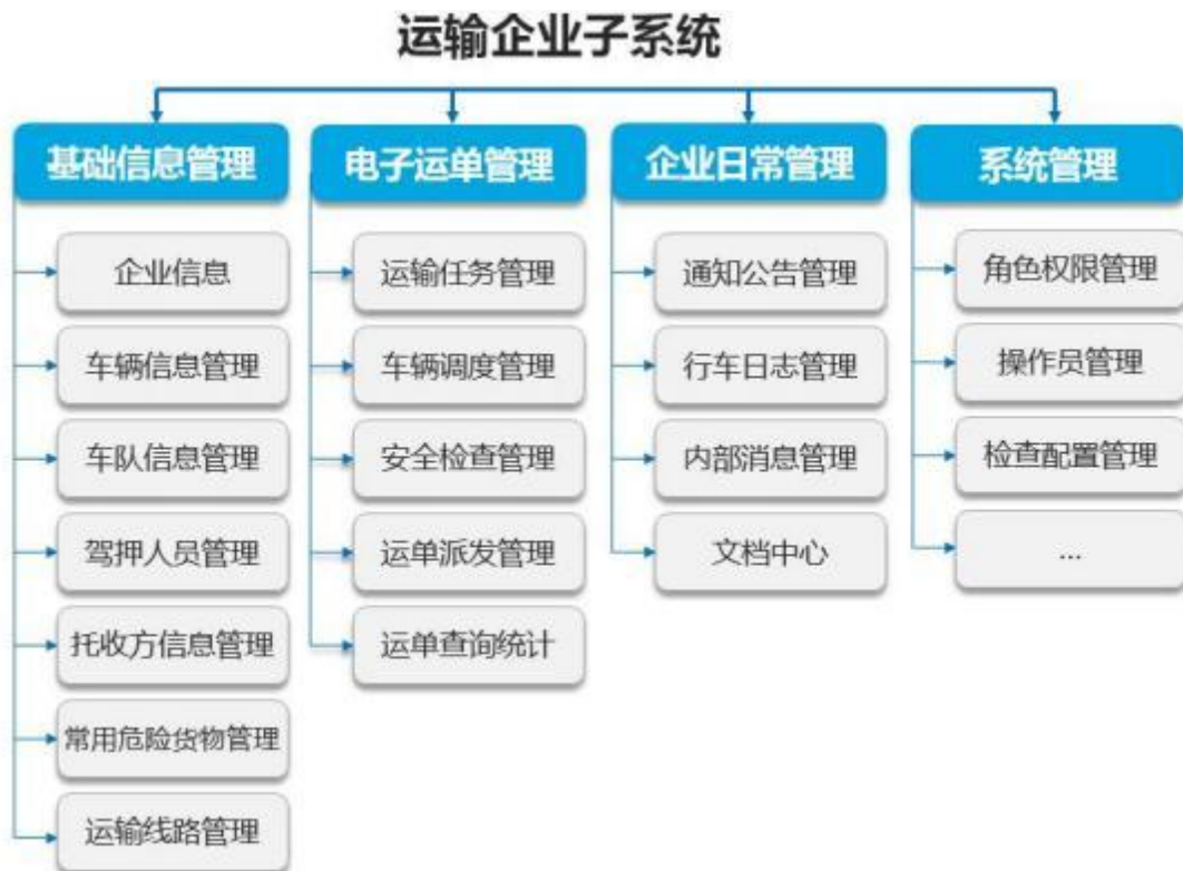
图 2 运输企业子系统功能架构

主要面向危险货物道路运输企业和驾驶员，帮助企业实现危险货物道路运输电子运单管理。系统主要功能框架如下图所示：