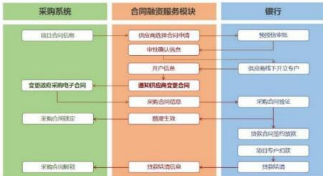
已签订采购合同申请流程

银行合作有效时间及授信额度贷款期限贷款利率仅供参考具体规定可登陆陕西省政府采购网( www.ccgp-shaanxi.gov.cn/ )重要通知专栏中查询了解。