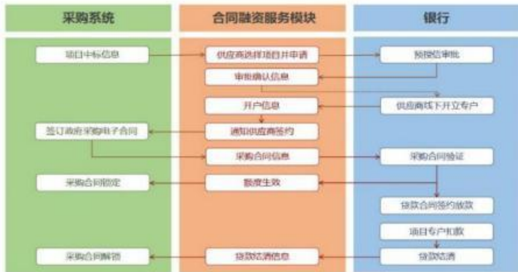
未签订采购合同申请流程