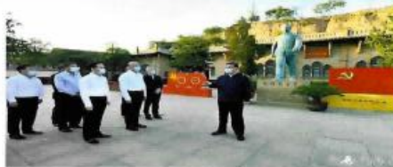
习近平在陕西榆林考察调研

习近平考察了国家能源集团神东煤炭分公司，听取了神东能源集团负责人介绍，并参观了神东煤炭分公司智能化采煤工作面，同企业职工交流，了解企业发展情况。