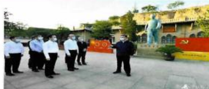
习近平在陕西榆林考察调研