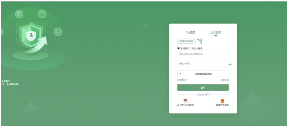
陕西省统一身份认证系统